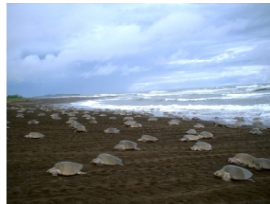
Arribada de Tortuga Lora en playa Ostional, Costa Rica.

Donantes: WWF, Grupo Especialistas en Tortugas Marinas de IUCN, Proyecto Canje Deuda Costa Rica-Canadá, Western Pacific Regional Fisheries Management Council.